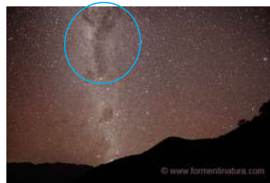
Constelación oscura de la llama (yacana) vista desde el camino inca a Machu Pichu y desde Choquequirao