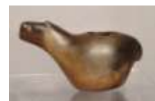
Constelación oscura de la llama (yacana), sendero oscuro entre Escorpio y Centauro, y conopas incas en forma de llama y alpacas (trazo sobre foto de Bauer y Dearborn 1998: 144)